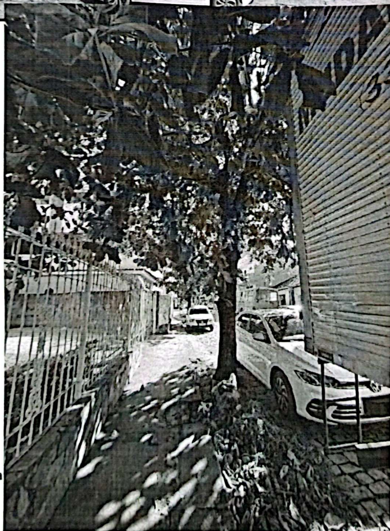
Figura 3. Calçada