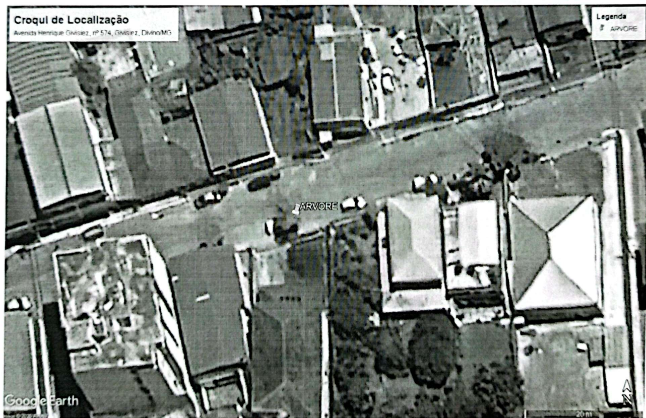
Figura 1. Imagem de Satélite com indicação do indivíduo arbóreo.

Fonte: Google Earth Pro (data imagem: 11/11/2023)