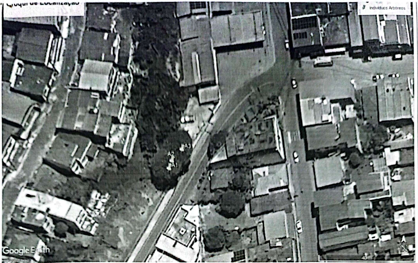
Figura 2. Imagem de satélite com indicação dos indivíduos arbóreos (A1, A2 e A3)