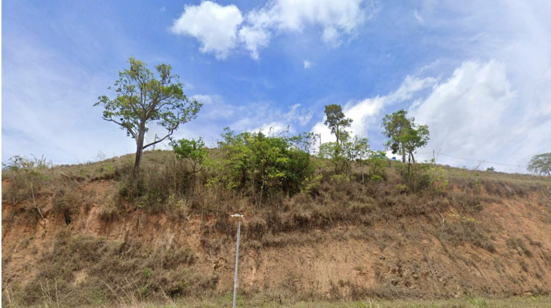
Figura 2 Indivíduos arbóreos