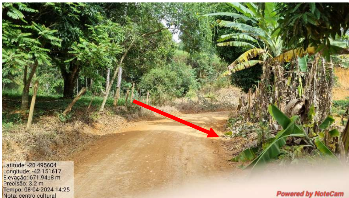
FOTO 10 - LOCALIZAÇÃO “BUEIRO” (foto aproximada do local da FOTO 09)