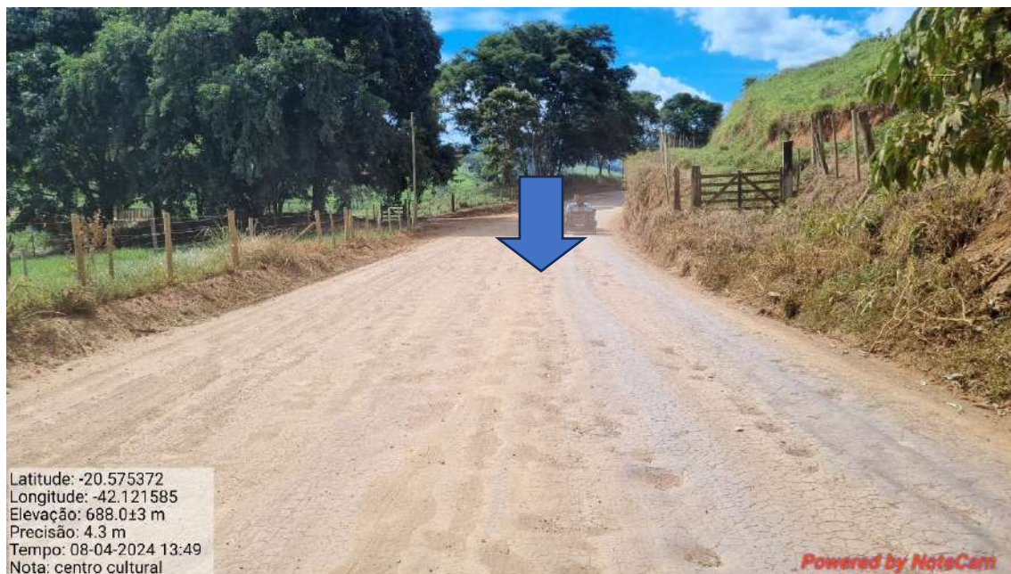
18 - APÓS 1.200,0 METROS DO INICIO DO TRECHO