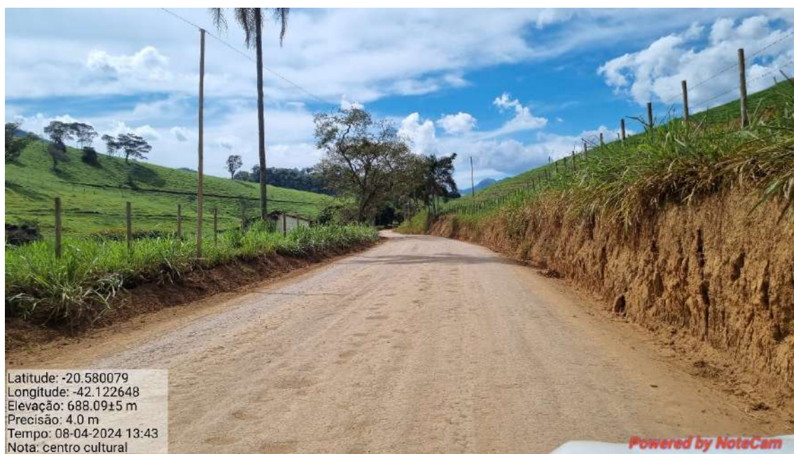
11 - APÓS 675,0 METROS DO INICIO DO TRECHO