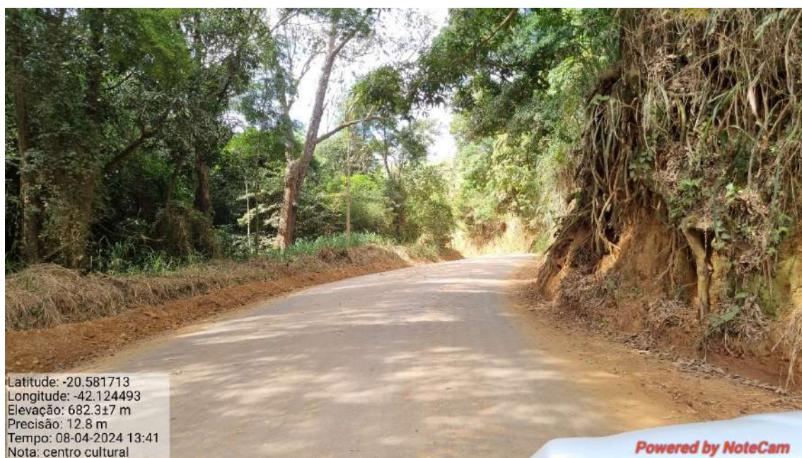
07 - APÓS 415,0 METROS DO INICIO DO TRECHO