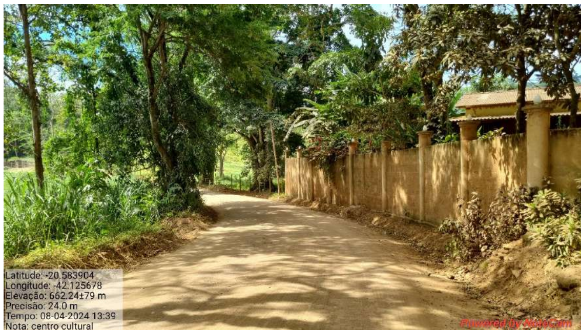
02 – APÓS 65,0 METROS DO INICIO DO TRECHO