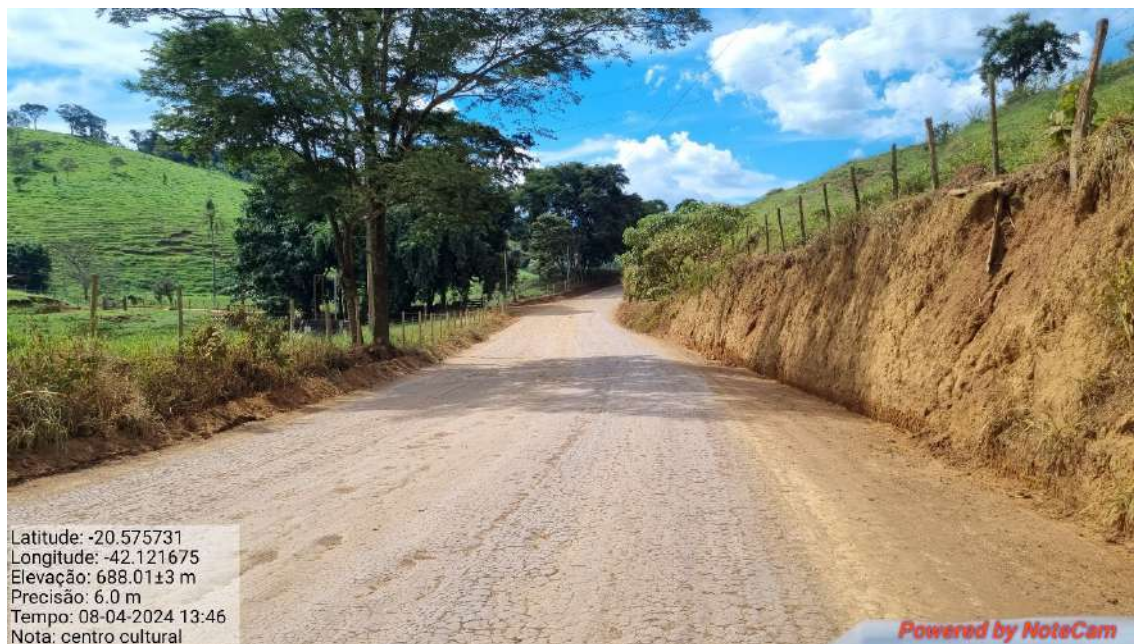
16 - APÓS 1.070,0 METROS DO INICIO DO TRECHO