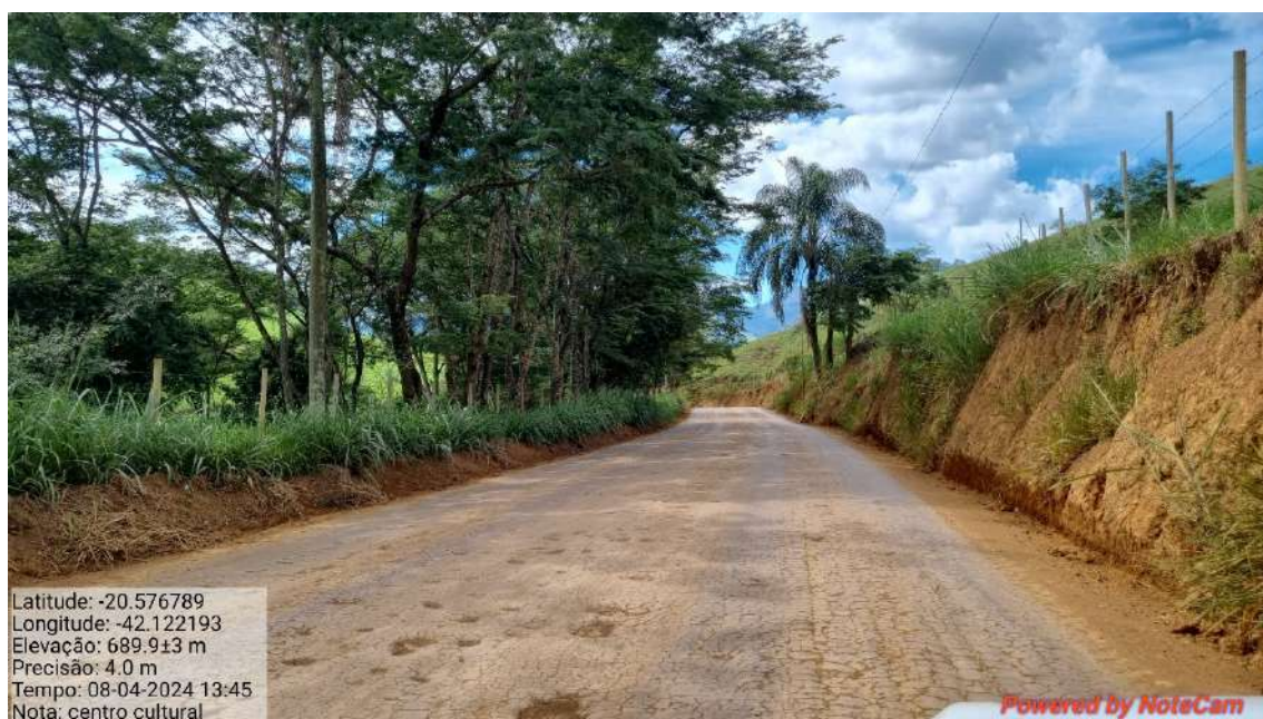
15 - APÓS 950,0 METROS DO INICIO DO TRECHO