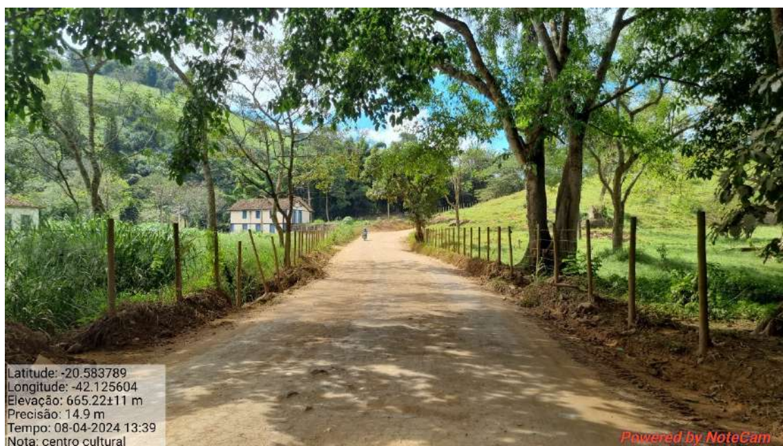
03 – APÓS 140,0 METROS DO INICIO DO TRECHO