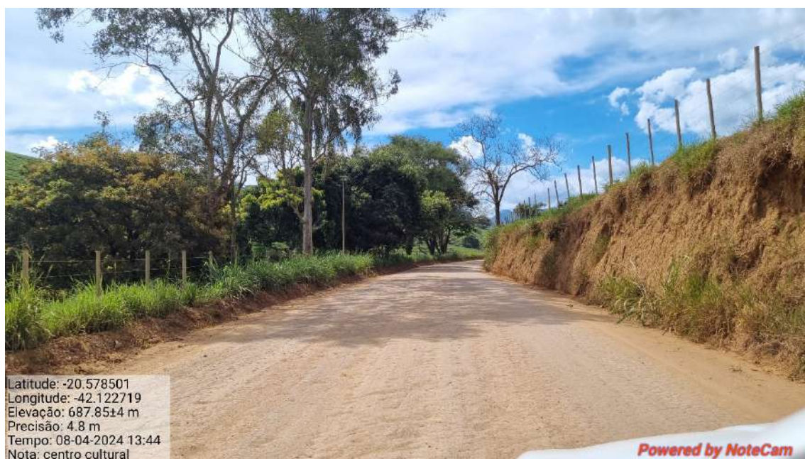
13 - APÓS 805,0 METROS DO INICIO DO TRECHO