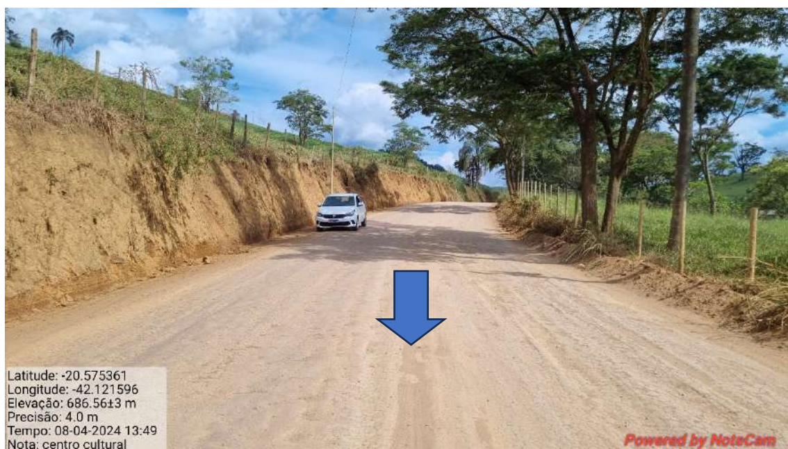
19 - APÓS 1.250,0 METROS DO INICIO DO TRECHO - FINAL DO TRECHO