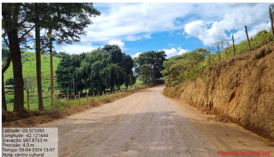
17 - APÓS 1.145,00 METROS DO INICIO DO TRECHO