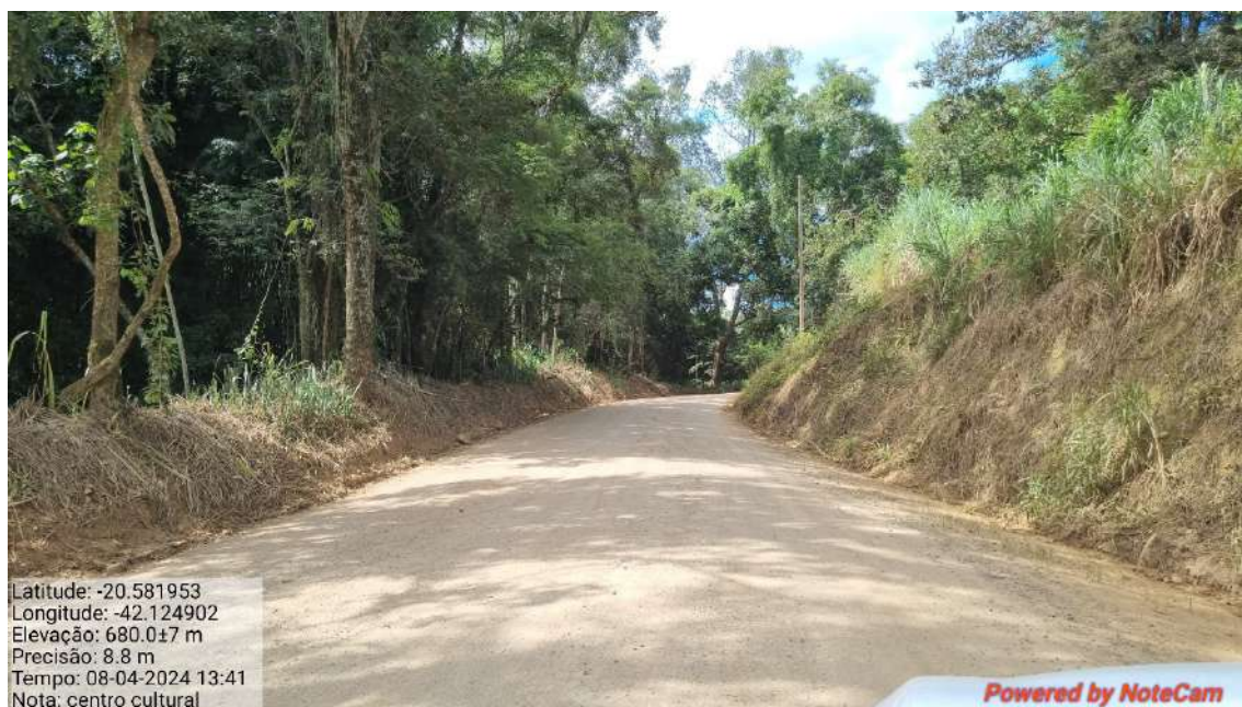
06 - APÓS 350,0 METROS DO INICIO DO TRECHO