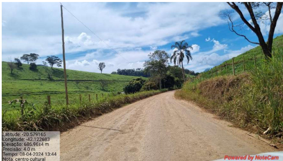
12 - APÓS 740,0 METROS DO INICIO DO TRECHO