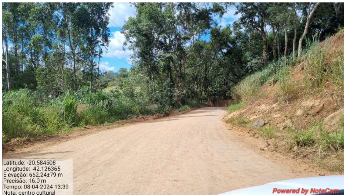
04 - APÓS 205,0 METROS DO INICIO DO TRECHO