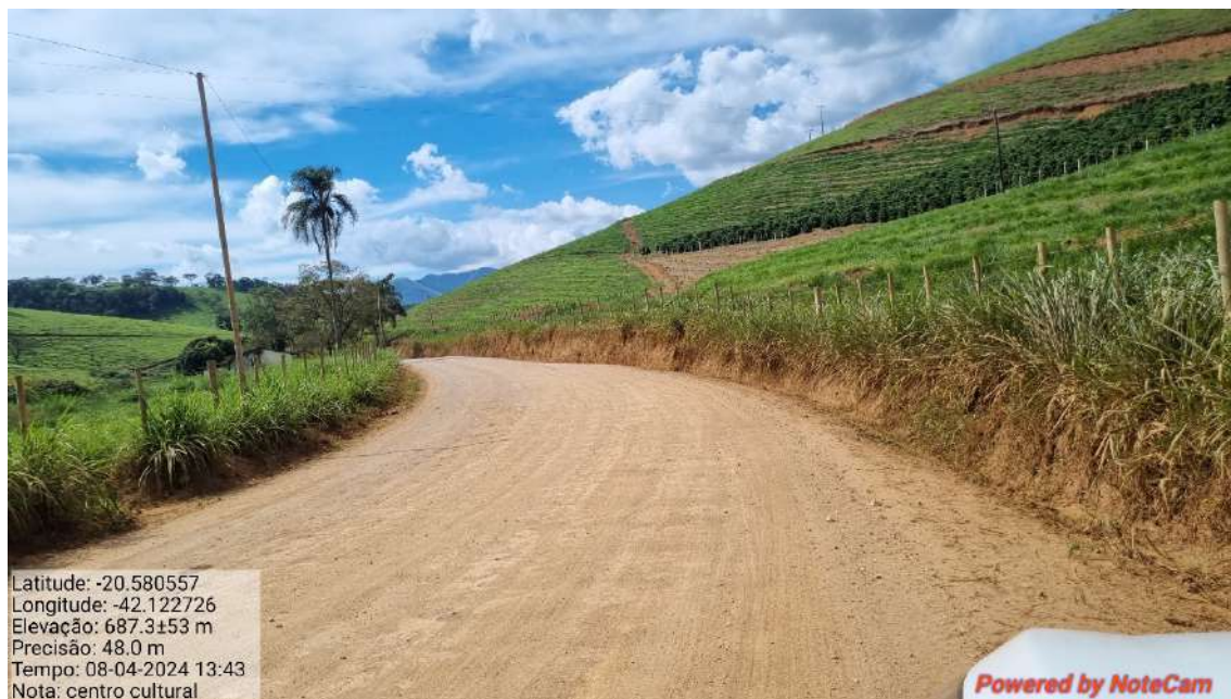
10 - APÓS 610,0 METROS DO INICIO DO TRECHO