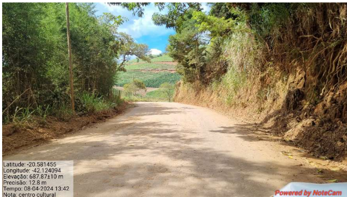
08 - APÓS 480,0 METROS DO INICIO DO TRECHO