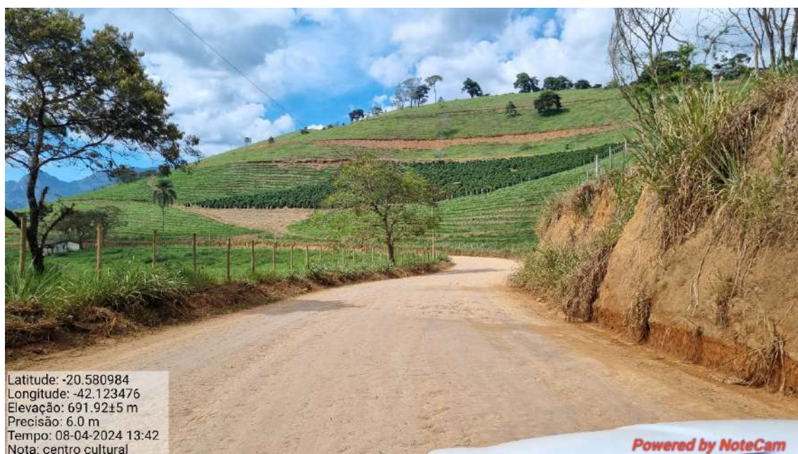
09 - APÓS 545,0 METROS DO INICIO DO TRECHO