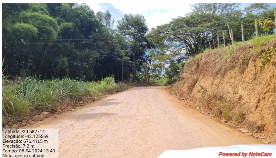
05 - APÓS 270,0 METROS DO INICIO DO TRECHO