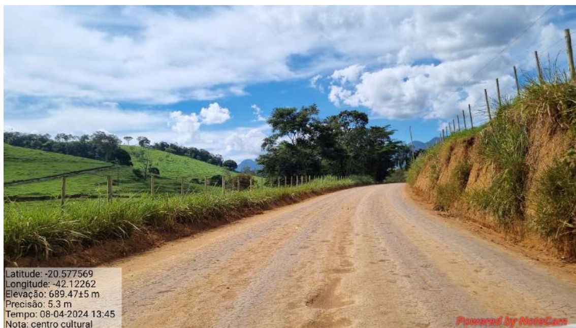
14 – APÓS 870,0 METROS DO INICIO DO TRECHO